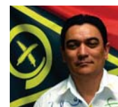
DÉPUTÉ MINISTRE DES FINANCES ET DE LA GESTION ÉCONOMIQUE RÉPUBLIQUE DE VANUATU