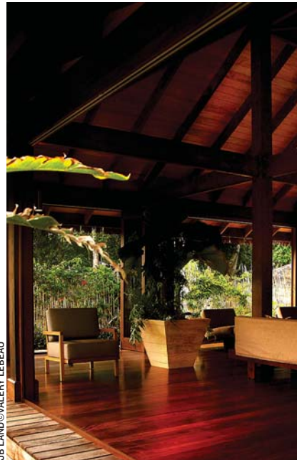
JB LAND@VALÉRY LEBEAU

En pratique vous allez donc acheter un bail existant qui vous donne droit à la jouissance de la parcelle décrite et toutes les constructions qui s'y trouvent.