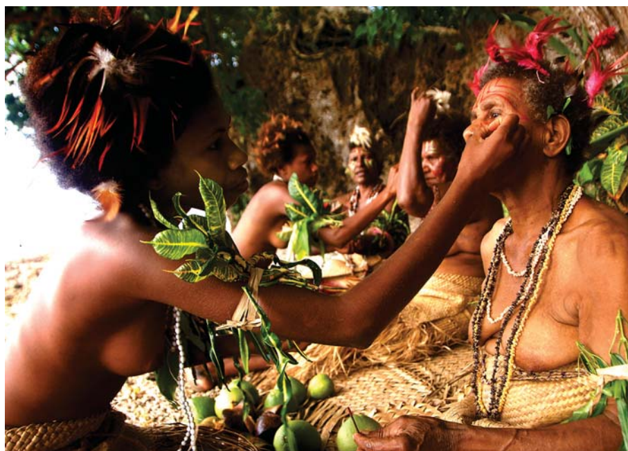
RICHESSSE CULTURELLE Ce sont les plus jeunes femmes qui maquillent leurs aînées avant un spectacle illustrant une célébration coutumière, Small Nambas à Walla Rano, Malicolo ( www.malampa.travel ).

Le Vanuatu offre à la fois des expériences exaltantes et des possibilités infinies, tant par sa nature que sa pluralité culturelle.